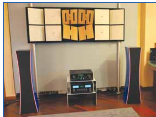
Installazione del sistema D.W.S in occasione di Percorsi Sonori nello scorso ottobre.

"Oggi si conosce il prezzo di tutte le cose, ma di nessuna il proprio valore"