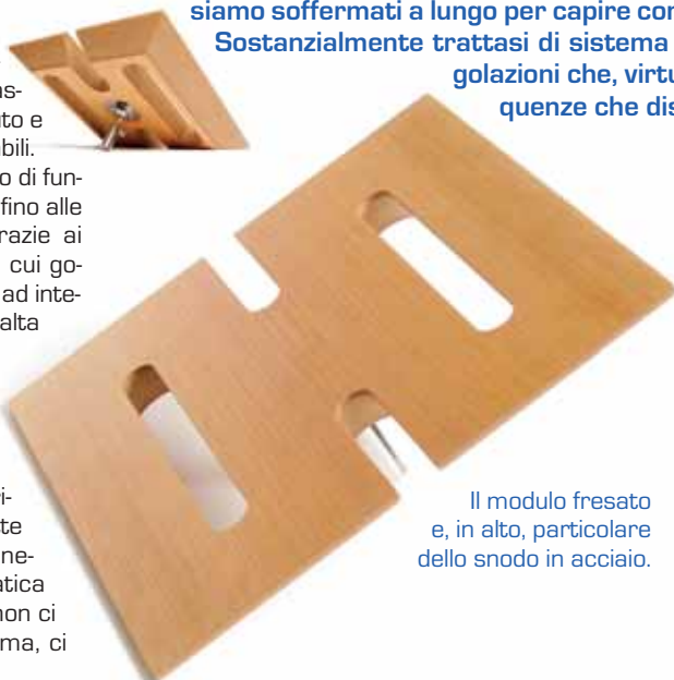
Il modulo fresato e, in alto, particolare dello snodo in acciaio.

La sua struttura è costituita da un pannello fonoassorbente rivestito in tessuto e dai moduli dinamici regolabili. Ovviamente il suo intervallo di funzionamento non si spinge fino alle note gravi ma riesce, grazie ai quattro gradi di libertà di cui godono i pannelli semoventi, ad integrare in gamma media e alta pulendo e arricchendo notevolmente il messaggio sonoro (più che arricchire, anche se questo è ciò che si percepisce alla fine, dovremmo scrivere pulire, pulire da tutte quelle riflessioni che ingenerano melma sonora e fatica d'ascolto, anche quando non ci sembra che essa, la melma, ci